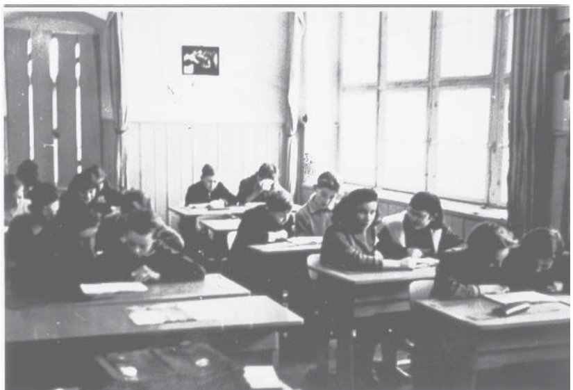
Schulzimmer in der alten Schule