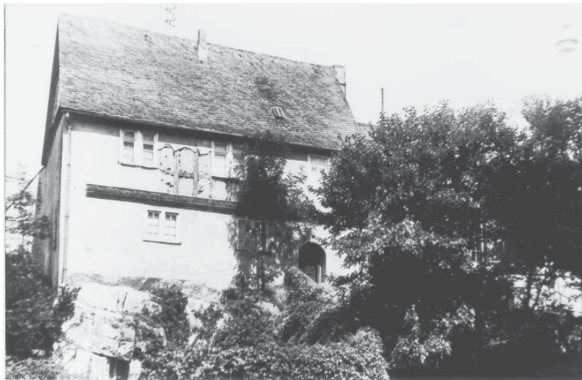
Die alte Schule vor der Renovierung

Die Schule mußte sich dem alltäglichen Leben anpassen: In den Spätsommermonaten fiel nachmittags der Unterricht aus, und die Schüler zogen mit auf die Felder, um bei der Flachs- und Kartoffelernte kräftig mitzuhelfen.