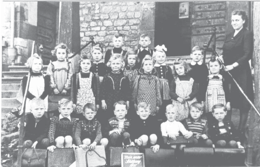
Der Schuljahrgang 1950. Ein Bild, aufgenommen vor dem Kirchenportal, wie es für viele Jahrgänge angefertigt wurde.